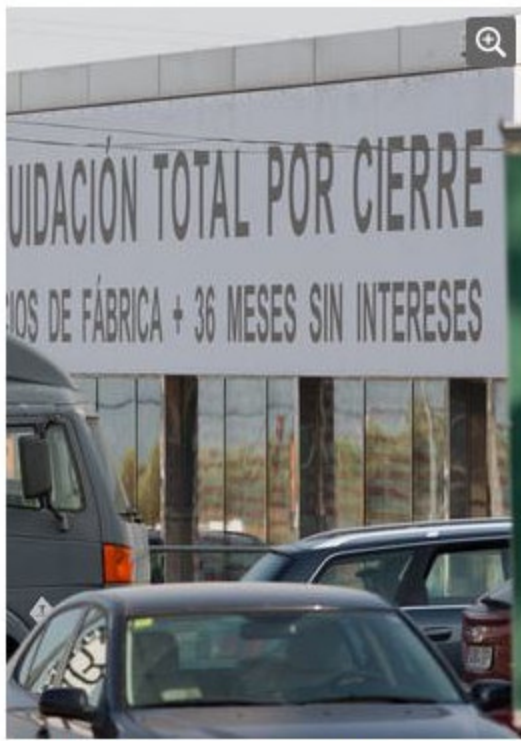
UN NEGOCI AFEBLIT El cartell d'aquesta empresa del clúster del moble de la Sénia il·lustra la situació de crisi que està patint el sector.

Fa només sis o set anys passejar-se un dissabte pels carrers de la Sénia era fer-ho per un poble que respirava comerç i dinamisme. El sector del moble d'aquest municipi del Montsià havia tocat sostre amb la bombolla immobiliària. La Sénia era un pol de peregrinació de compradors que arribaven sobretot d'arreu de Catalunya, l'Aragó i el País Valencià. En l'imaginari català, comprar-se els mobles a la Sénia era sinònim de prestigi per als que s'acabaven de casar. Amb més de 100 empreses i 30.000 metres quadrats d'exposició, la Sénia té l'oferta comercial més gran de Catalunya, l'Aragó i el País Valencià. Un pol econòmic que, després d'anys de prosperitat i expansió, ara viu un moment crític.